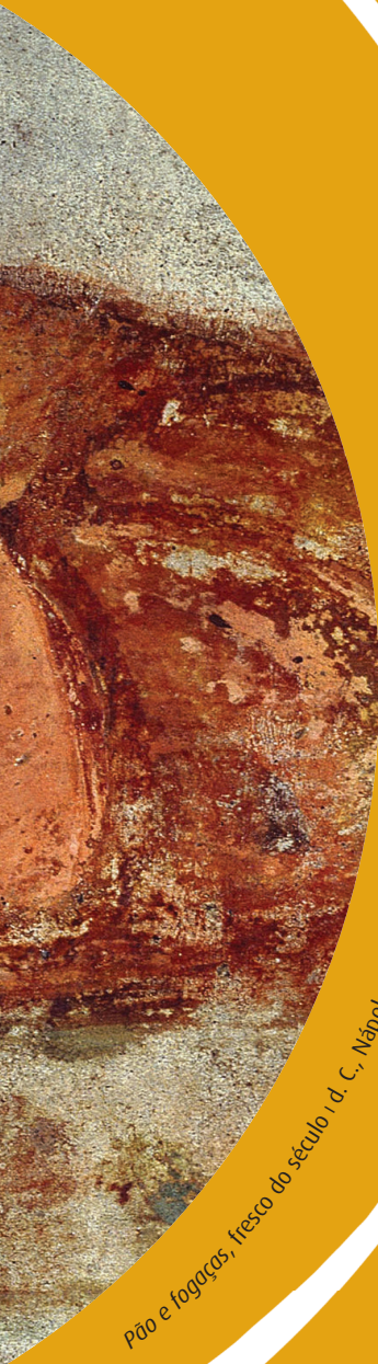
Pão e fogaças, fresco do século I d. C., Nápoles, Museu de Arqueologia